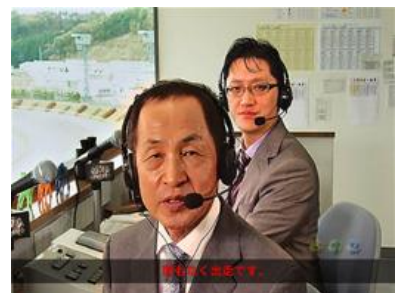
實況區中宣言出戰比賽的話則發展確定，其他的話則為假演出