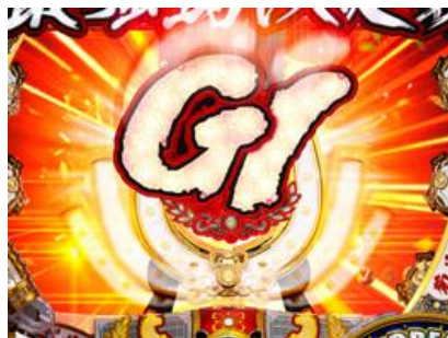
各種場面都有機會出現，兩個合體時為大好機