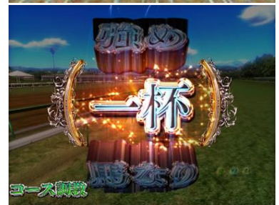
各種場景發展各種調教，調教內容有五種，會使育成馬的能力上升