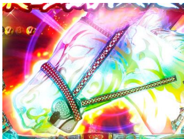
巨大鞭子掉下來時為好機，巨大鞭子回轉後完成馬頭役物時為激熱!