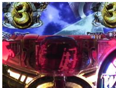
顏色或是出現的文字要注意