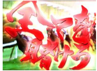
賽馬立直發展的機會預告演出，顯示的比賽階級需要注意，是 GI 時期期待度上升