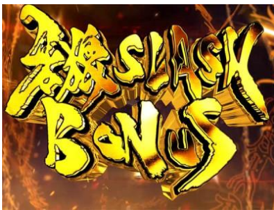
牙狼 SLASH BONUS