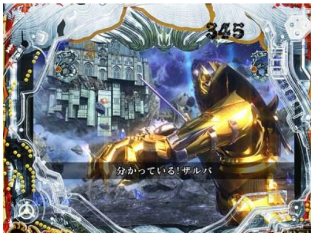
存在最大三次的機會