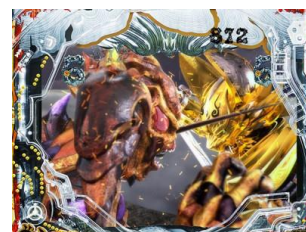
牙狼與ホラー對決，擊破ホラー時為大當濃厚