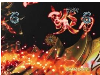
到達我が名は牙狼的話...