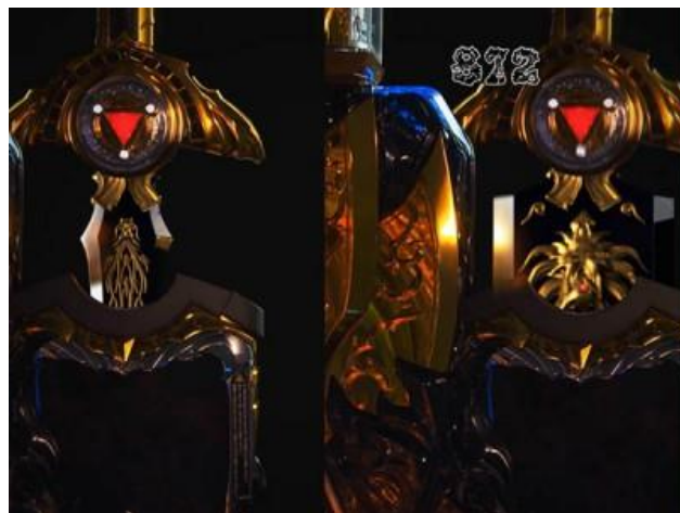
拉出的劍是斬馬劍的話...