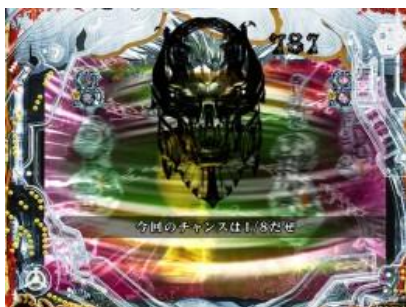
大當圖案增加時則為好機