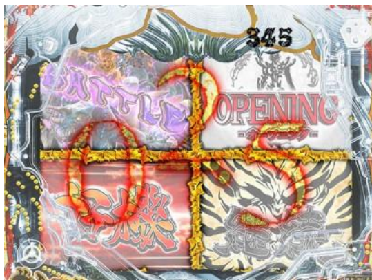
標題暗轉後發生，計時器到 0 時 會發生選擇的面板的演出