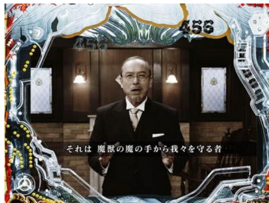
カオル出現時為大好機