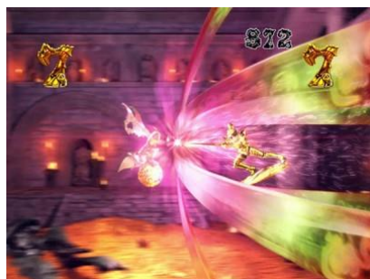
牙狼視點進行演出的新雨宮 SP 立直，發展時期待度大 成功時突入 ST 濃厚!