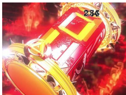
牙狼轉輪停止 V 時則獲得大當