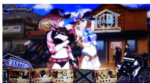
WEST EDGE TOWN