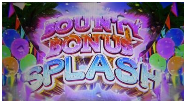
BOUNTY BONUS SPLASH

純增約 2.8 枚/G 的擬似 BONUS，BOUNTY BONUS 至少 20G，AT 期待度約 40% BOUNTY BONUS SPLASH 至少 40G，AT 期待度約 67%。消化中突入 BONUS 中的 CZ 時為當選 AT 的好機，抓到 7 連線則當選 AT 濃厚。AT 中的 BONUS 如果 7 連線會突入 GOLDEN ZONE