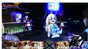
FINKY CATS BAR