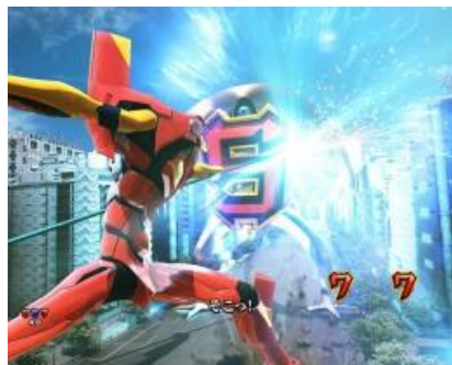
二號機 VS イスラフェル