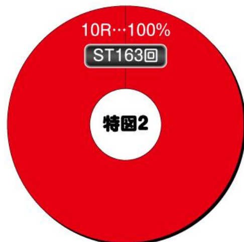
大當 ROUND 數分配比例-電嘴入賞時