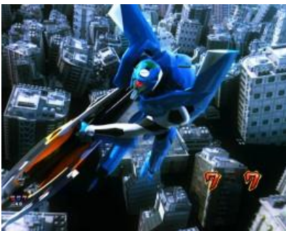
零號機 VS レリエル