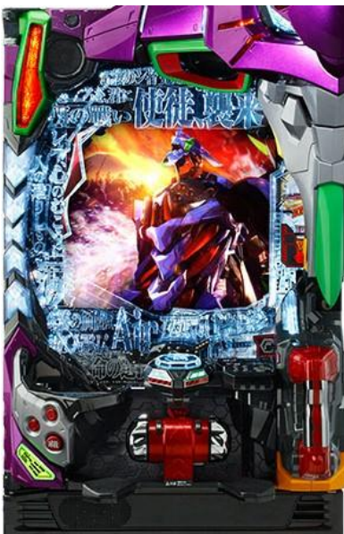
千珠平均該到達回轉數