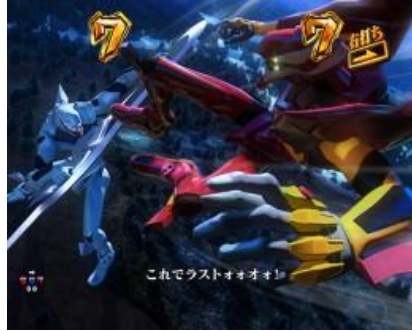
二號機 VS EVA 量産機