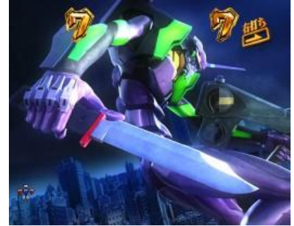
初號機 VS シヤムシエル

ST 中發生的 EVA 系立直有三種，要注意判定用的役物は按鍵還是拉桿，拉桿則期待度大 也有煽動時先出現按鍵後變成拉桿的激熱演出