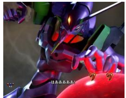
初號機 VS ゼルエル

EVA 系立直有上面三種，最右邊的期待度最高，發展時的螢幕切入演出與最後的切入演出的顏色 必須要注意，發展時白色<紅色<金色，特殊武器發生時登場的角色是源堂與冬月或加持時則期待升