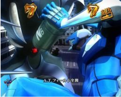
零號機 VS イスラフェル