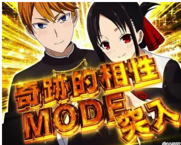
ENDING 到達後一定突入的上位模式 32G 內當選 SBB 確定且 80%LOOP 此模式