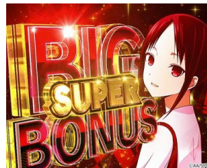
SUPER BIG BONUS