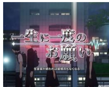
戀愛頭腦戰的最後會發展連續演出，成功則當選 CZ 以上，期待度上面越右邊的期待度越高 上述未列出的還有一個かぐや様は差されたい期待度為下面數上來第二個