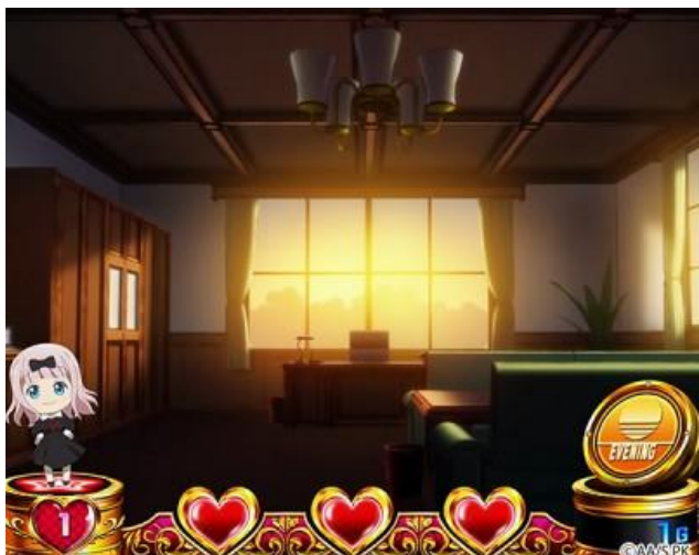
BONUS 結束後突入的 100G 拉回機會 在這當選 BONUS 時為 BB 以上濃厚