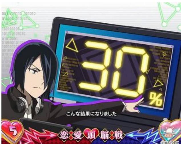
為前兆場景的戀愛頭腦戰中，各種演出都會示唆 期待度，發展連續演出前期待出現高期待演出