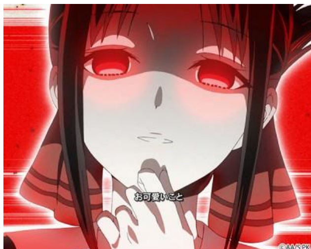
戀愛頭腦戰中有機會發生的大好機演出 發生時期待度大幅上升