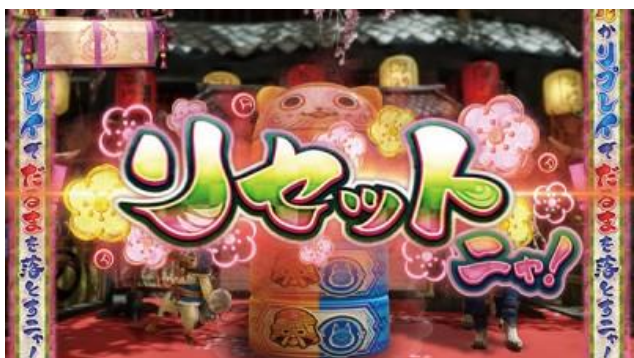
敲掉不倒翁一層則 ST 轉數重置