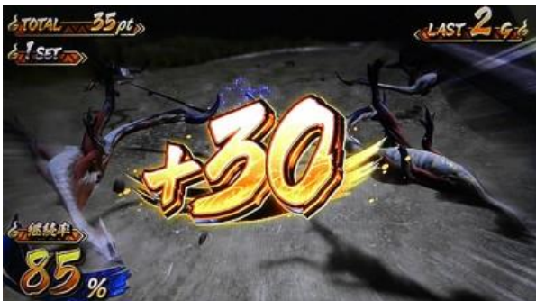
上乘カムラ點數與繼續率