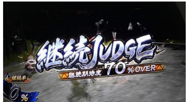
每 5G 進行繼續判定

點數獲得期待度為：不中小役 < RP < 銅鐘 < 弱櫻/西瓜/弱機會牌 < 強櫻/強機會牌，第 5G 會依照獲得 的繼續率來抽選繼續，成功則多 5G，每過 5SET 時獲得加倍點數 ICON，過 20SET 則獲得 紫 7 BONUS 濃厚。超過的累積點數會留到 AT 後使用(有利區間未重置時)