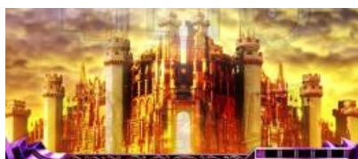
アフロディテ之門