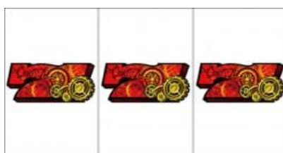
紅 7 連線