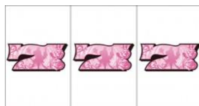
白 7 連線

BIGBANG 連線(確率 1/8192)獲得究極降臨轉蛋+金勝撫罐, 且神之勝撫勝利 11 次必突入夢想 6 次以內也有 75%機率突入。紅 7 連線(確率 1/7282)為 AT 50G 以上+獲得金勝撫罐 白 7 連線(確率 1/6554)為 AT 30G 以上+獲得金勝撫罐