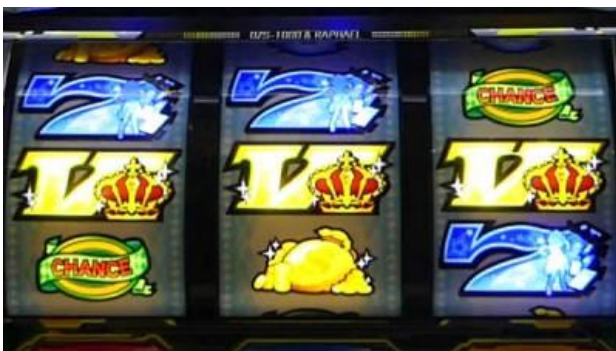
金 V 連線