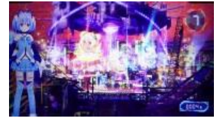
THE WORLD OF HEAVEN