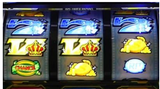
藍 7 連線

通常時金 V 連線為 AT 100G+ 雙重攻擊三次、藍 7 連線 AT 100G+ 雙重攻擊