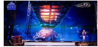
時間扭曲裝置場景

通常時的場景有左馬介、傑克、平八場景三種，哪個場景便黃昏時為點數高確示唆，米雪兒場景為前兆示唆場景，移行時突入百鬼模式以上濃厚。時間扭曲裝置場景為超高確示唆。小役成立時可以獲得點數，到達規定的點數(100~500 點)時突入百鬼模式，弱特殊小役會抽選(超)點數高確(超)高確中較容易獲得點數，消化轉數時也會抽選(超)高確，每消化 200G 一定移行高確以上濃厚