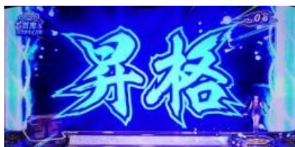
STEP UP 告知