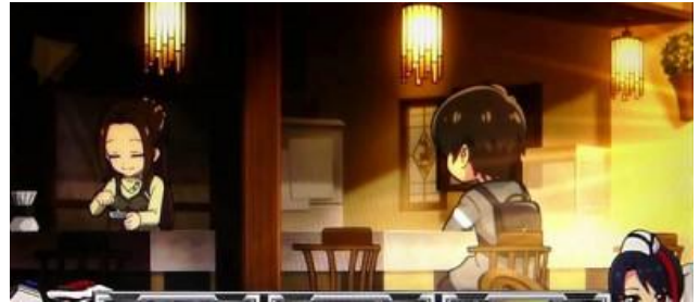
ミルクディッパー

通常時規定轉數(111.222.333...等)消化時為當選 BONUS 的好機，小役計數器滿時為 CZ 的好機 基本場景為街道中與河川邊，ミルクディッパー移行時為示唆高確，高確中較易累積小役計數器