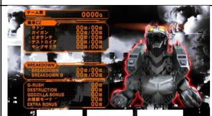
設定 6 濃厚