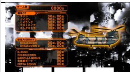
偶數設定期待度上升