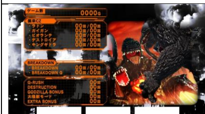
次回襲來 ZONE 對手為 幾乎為キングギドラ 但可能出現デストロイア