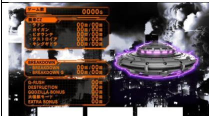
天國模式期待度上升