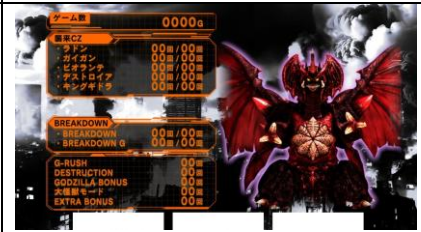
G 點數 399 點以內濃厚