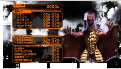
三次 CZ 內一次天國模式