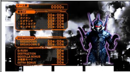
兩次 CZ 內一次天國模式