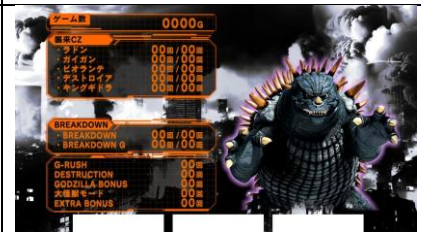
三次 CZ 內都無模式 A