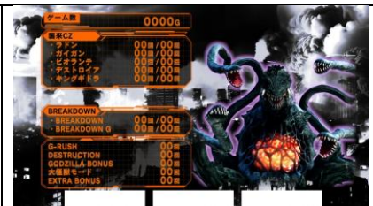
六次 CZ 內兩次天國模式