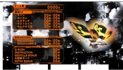
六次 CZ 內三次天國模式