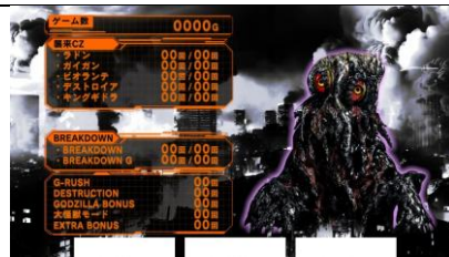
模式 B 以上期待度上升