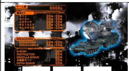
高設定期待度大上升