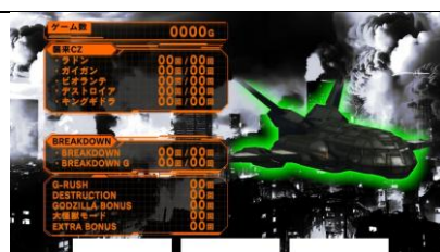
設定 4 以上濃厚