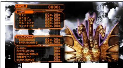
當下天國模式濃厚