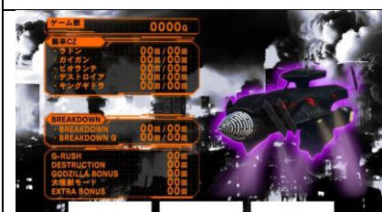
設定 2 以上濃厚