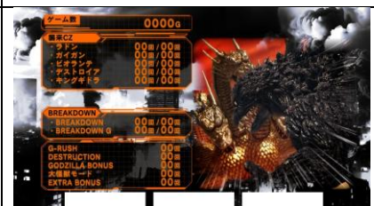
次回襲來 ZONE 對手為 ビオランテ以上