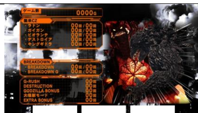
次回襲來 ZONE 對手為 デストロイア以上