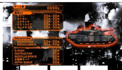
高設定期待度上升