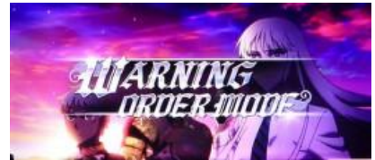
軍事準備命令模式

通常時與 AT 中每轉都會依照成立小役抽選 KOKO 點數至少 1 點，特殊小役為 5 點以上到達 1000 點時會抽選 CZ(AT 中會抽選故事)，KOKO 點數高確中會較容易增加點數移行高確的契機為 100G 週期到達時、超高確轉落後、CZ 失敗後、AT 結束後的四種除此之外特殊小役也會抽選 CZ，內部狀態會影響當選率，弱櫻與西瓜會抽選 CZ 高確或超高確 AT 結束時為移行 CZ 高確的好機，100G 週期有機會突入 CZ 超高確。通常時場景基本為旅館與訓練場，雅加達為高確示唆，發射場為超高確示唆。超高確中成立特殊小役當選 CZ 濃厚軍事準備命令模式為 CZ 或是 AT 的前兆場景