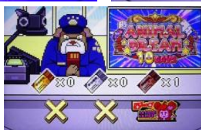
銀色票券(二擇押順指示)