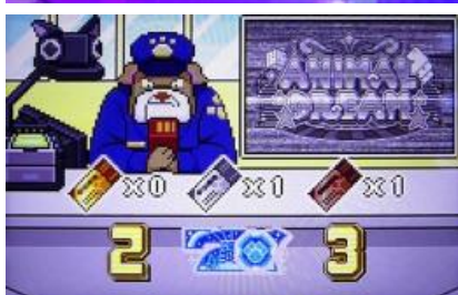
金色票券(全押順指示)