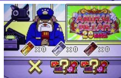
銅色票券(四擇押順指示)

BIG 結束後或是 REG 後的一部分突入的 CZ，票券會有 1~3 張，之後發生猜押順挑戰，猜中一次則獲得 ST 10G，押順指示會照票券種類有所變化，特殊小役成立時會抽選票券升格或多一張