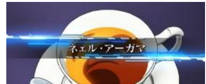
ネエル・アーガマ