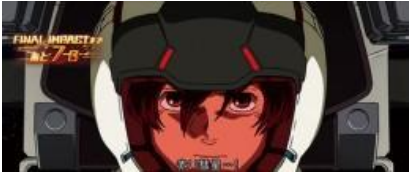
第 1~7 轉