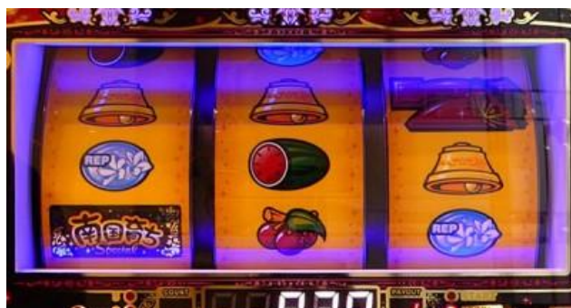
轉輪周圍燈光顏色

RP 的得分音變化時為示唆滯在高模式。BONUS 結束時轉輪周圍燈光有亮的話則要注意顏色 高模式滯在期待度為：藍<綠<紅<彩，紅色為通常 B 以上、彩色為(超)飛翔模式濃厚